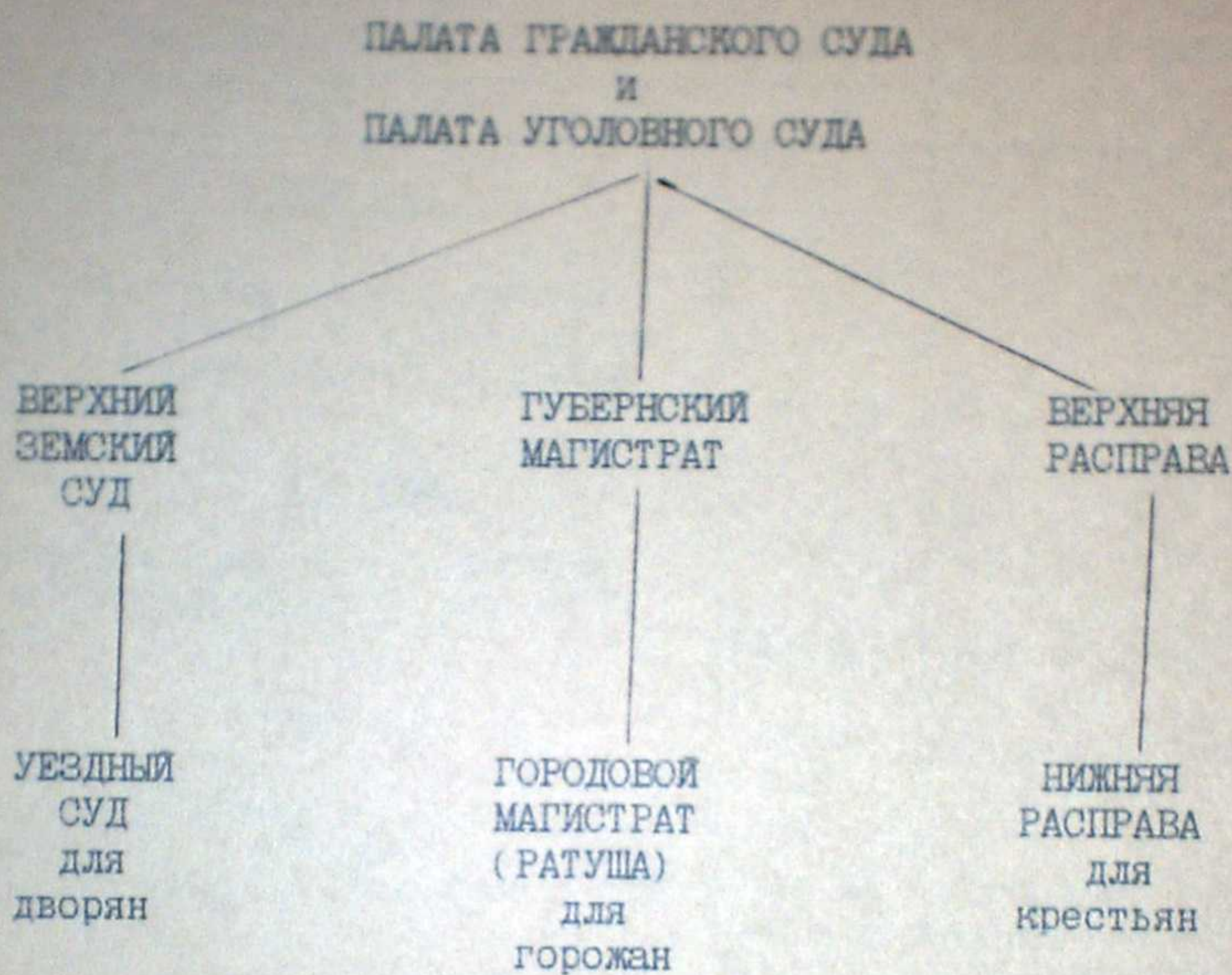
Схема построения сословной судебной системы в России в 1775-1841 гг.