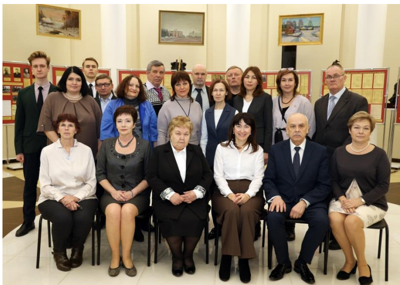
г. Саранск, 2 марта 2023 г.