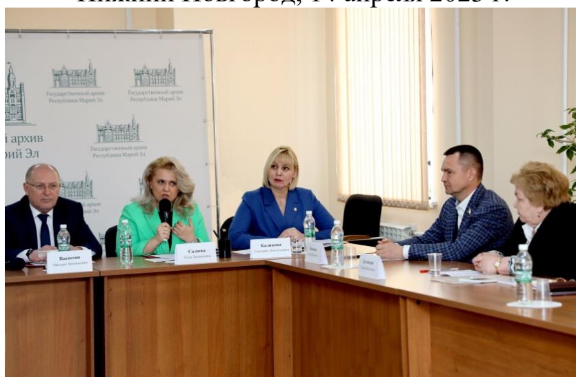
г. Йошкар-Ола, 4 мая 2023 г.