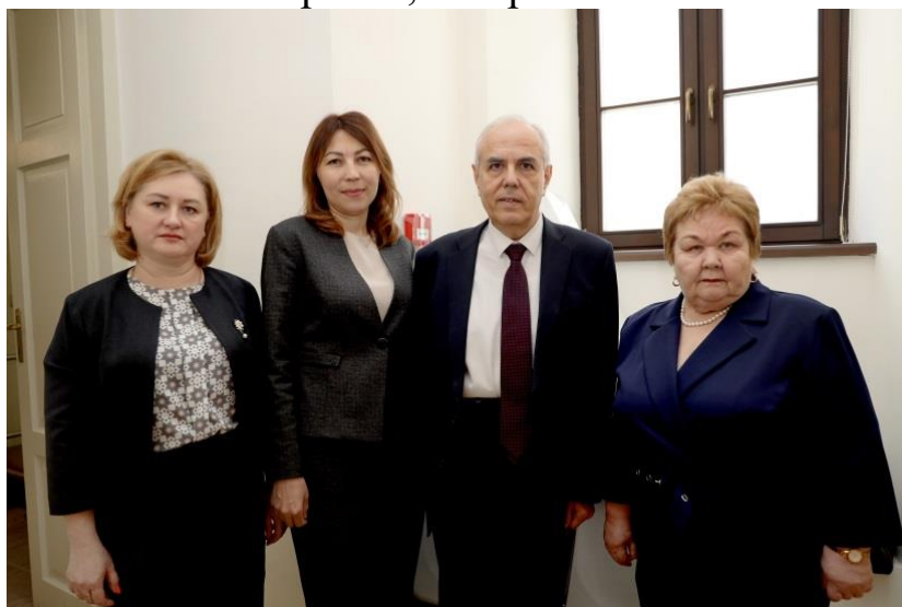
Нижний Новгород, 14 апреля 2023 г.