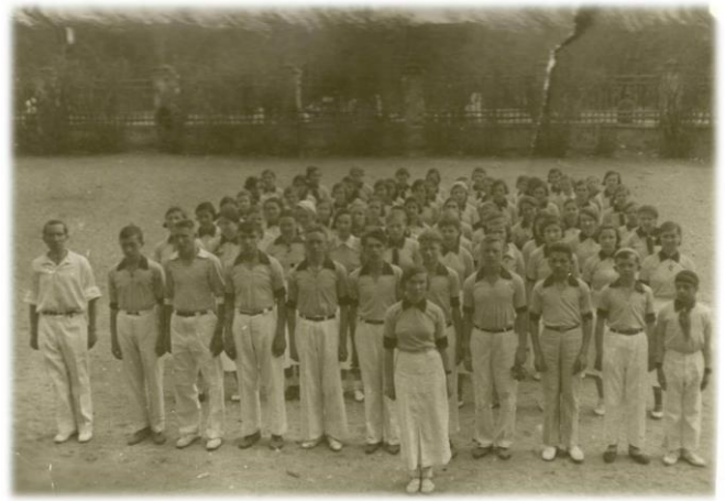
10 «Е» класс построены на парад! Школа № 1 РУЖД. Сентябрь 1940 г.