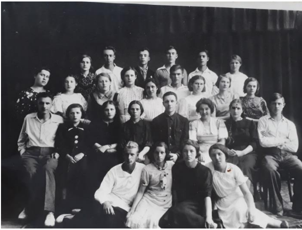
Выпускной 10 класс школы № 1 РУЖД. 1941 г.